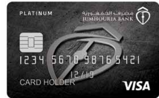
بطاقة PLATINUM PLATINUM Card