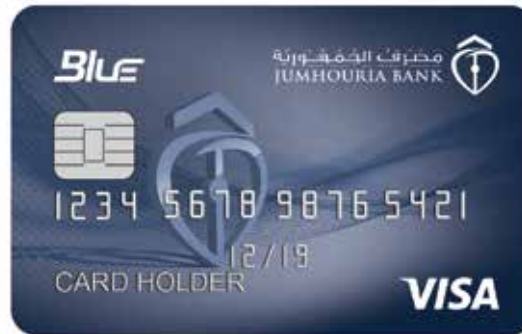
بطاقة BLUE The Blue Card