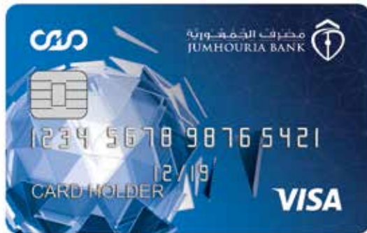
بطاقة مدى (فيزا) The Mada Card (VISA)