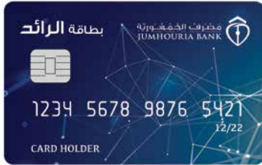
بطاقة الرائد Al Raed Card