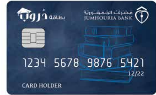
بطاقة (دروب) المسبقة الدفع (خاصة بالطلبة) The (Doroub) Prepaid Card for Students