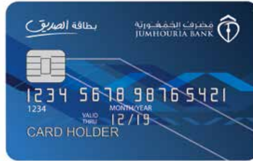
بطاقة الصديق (محلية بخصم مباشر) The Friend/Sadeeq Card (local card with direct billing)